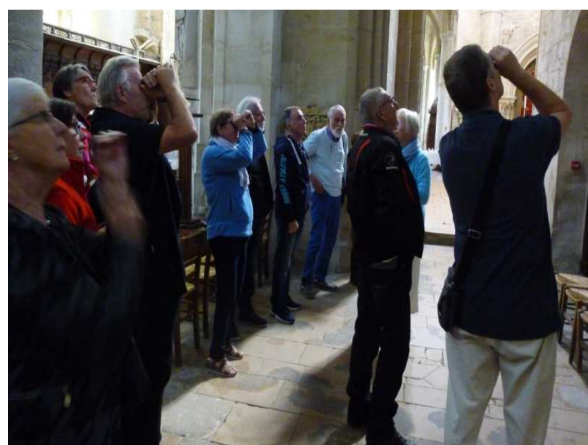
Quand on regarde un tableau et qu'il y a des reflets, il faut se servir de ses mains comme une longue-vue.