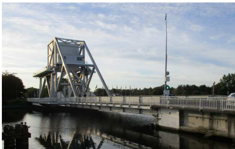
Le pont Pégasus